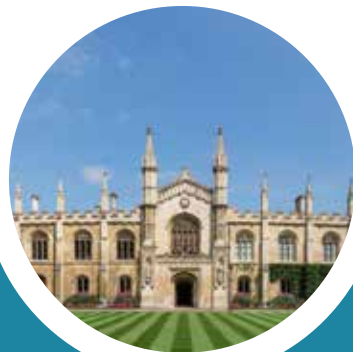
考伯思克里斯蒂学院