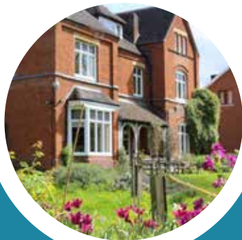
露西卡文迪许学院